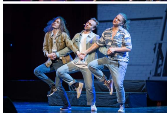
Broadway 2019, 26 i 27 maja 2019