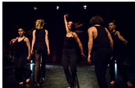
Wieczór tańca, 26 kwietnia 2019, fot. Dariusz Kulesza