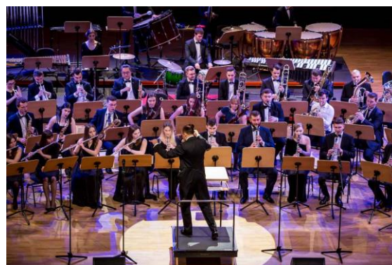
Orkiestra Dęta Akademii Muzycznej