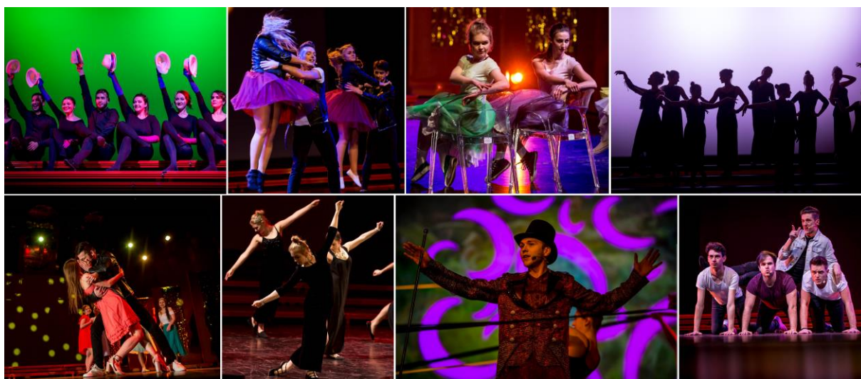
Studenci specjalności musical i rytmika, Z musicalem w Nowy Rok, 4 i 5 stycznia 2019