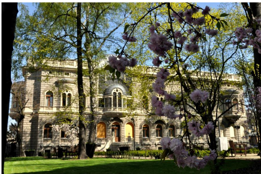
Pałac Akademii Muzycznej w Łodzi