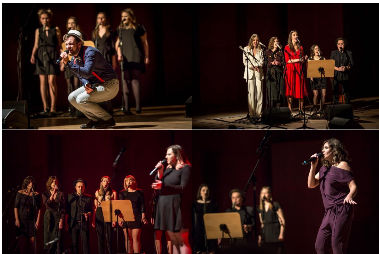
Na zdjęciach studenci specjalności wokalistyka estradowa podczas koncertu Życzenia z całego serca , 14 stycznia 2018

Programy koncertów w wykonaniu studentów Wydziału Wokalno-Aktorskiego, zaplanowane na 1 marca i 25 maja 2018 roku zamieniły się miejscami 😊 Jako pierwsi, 1 marca (czwartek) wystąpią wokaliści tworzący Chór Gospel, a 25 maja (piątek) studenci specjalności musical z przedstawieniem Broadway 2018. Za utrudnienia przepraszamy i zapraszamy do udziału w proponowanych przez Akademię wydarzeniach.