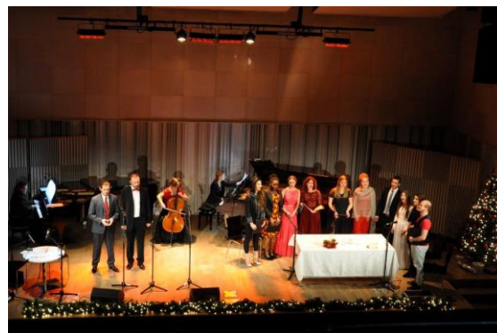
Koncert kolęd, 19 grudnia 2016

Podczas ostatniego w roku koncertu z cyklu Wieczory muzyczne studenci specjalności wokalnno-aktorskiej, podobnie jak w poprzednich latach, prezentować będą najpiękniejsze polskie i zagraniczne kolędy. Studenci zainicjują popularne melodie, dołączy do nich zgromadzona publiczność, a świąteczna atmosfera zapanuje już na dobre. Kolędowy koncert w bożonarodzeniowym nastroju odbędzie się 18 grudnia (poniedziałek) o godzinie 18.15, w Pałacu Akademii Muzycznej w Łodzi, przy ul. Gdańskiej 32. Wstęp wolny.