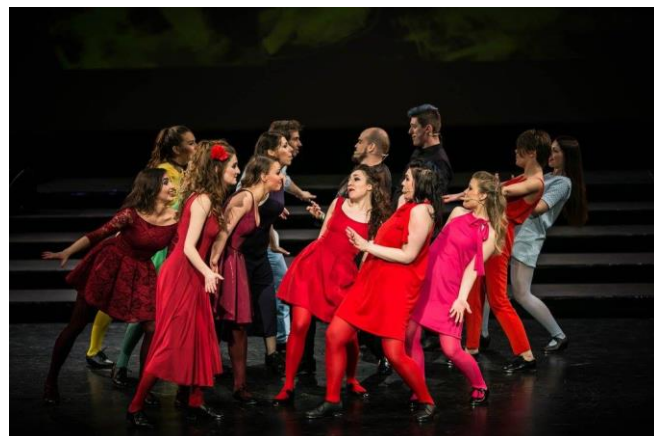
Na zdjęciu studenci specjalności musical podczas przedstawienia Carnival , 12 maja 2017

(środa) o godzinie 18.00 w Sali Koncertowej Akademii Muzycznej, przy ul. Żubardzkiej 2a. Bilety na koncert studentów w cenie 20 zł i 10 zł nabyć można w kasie biletowej AM.