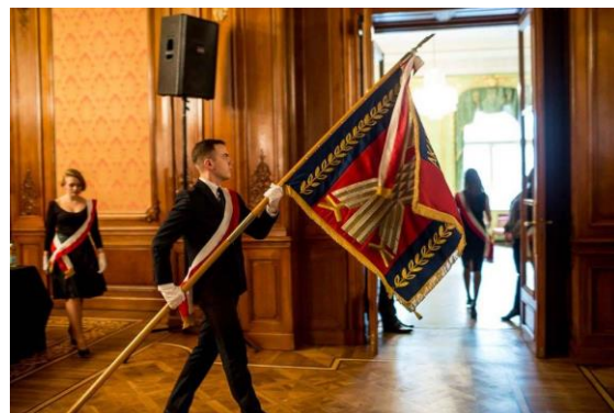
Na zdjęciach: zagraniczni goście, władze Uczelni, doktorzy sztuki, studenci, pracownicy Uczelni, Chór Kameralny AM, Orkiestra Smyczkowa PRIMUZ

Redakcja: Marta Włodarczyk, Biuro Promocji Akademii Muzycznej w Łodzi