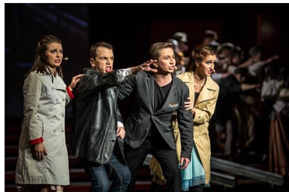
Musical Łódź Story – premiera wersji II