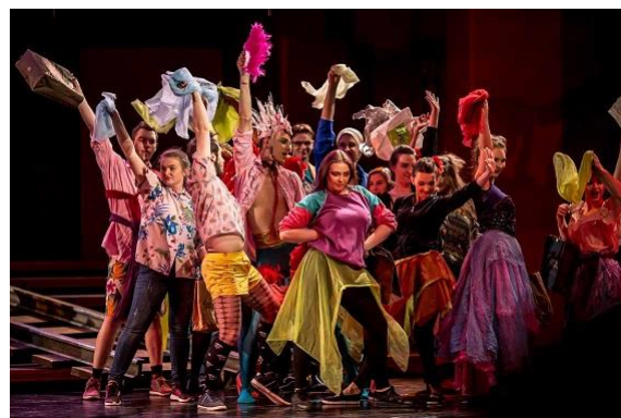
Musical Łódź Story – premiera wersji II