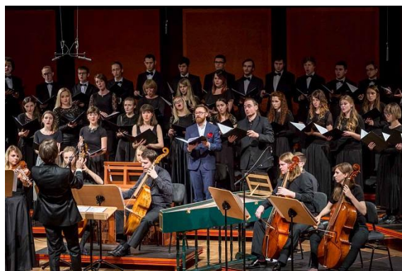
Koncert Muzyka Dawnych Wieków