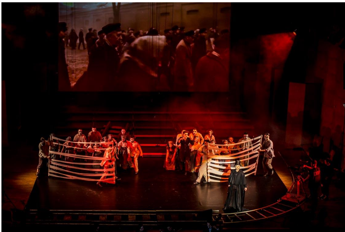
Łódź Story , 22 listopada 2016, premiera II wersji

Laureatom i Pedagogom serdecznie gratulujemy!