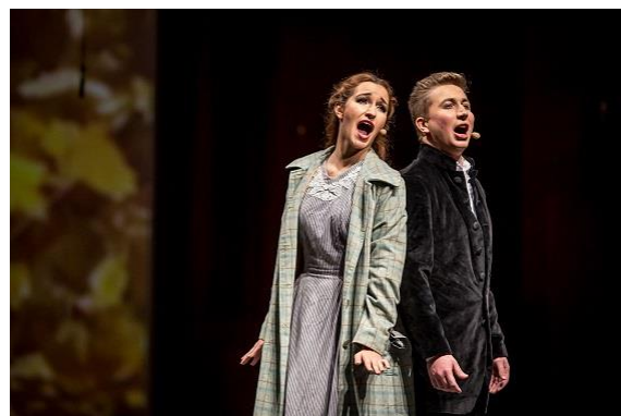
Musical Łódź Story – premiera wersji II

Podczas AŻ Festiwalu musical Łódź Story w nowej, kameralnej wersji miał swoją premierę, która cieszyła się niezwykłym zainteresowaniem widzów. Musical Łódź Story , w odróżnieniu od pozostałych wydarzeń festiwalu, zostaje w repertuarze Akademii na dłużej; planowanych jest jeszcze 7 przedstawień, a trzy z nich odbędą się już 5, 6 i 7 grudnia w Sali Koncertowej Akademii Muzycznej o godzinie 18.00. Bilety można nabyć w kasie biletowej AM przy ul. Żubardzkiej 2a lub zarezerwować telefonicznie pod nr. 42 662 17 50.