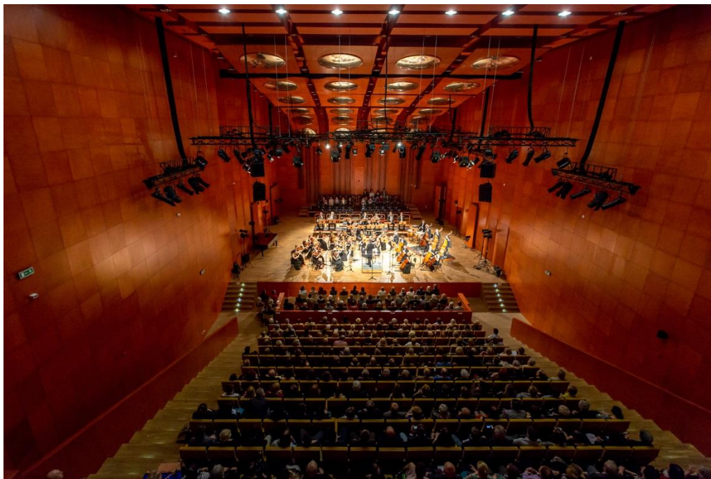
Sala koncertowa AM, ul. Żubardzka, fot. Dariusz Kulesza