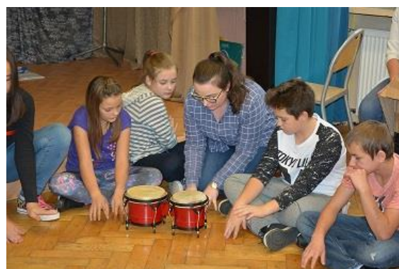
Na zdjęciach prowadzący i uczniowie klas IV-VI SP nr 111 w Łodzi.