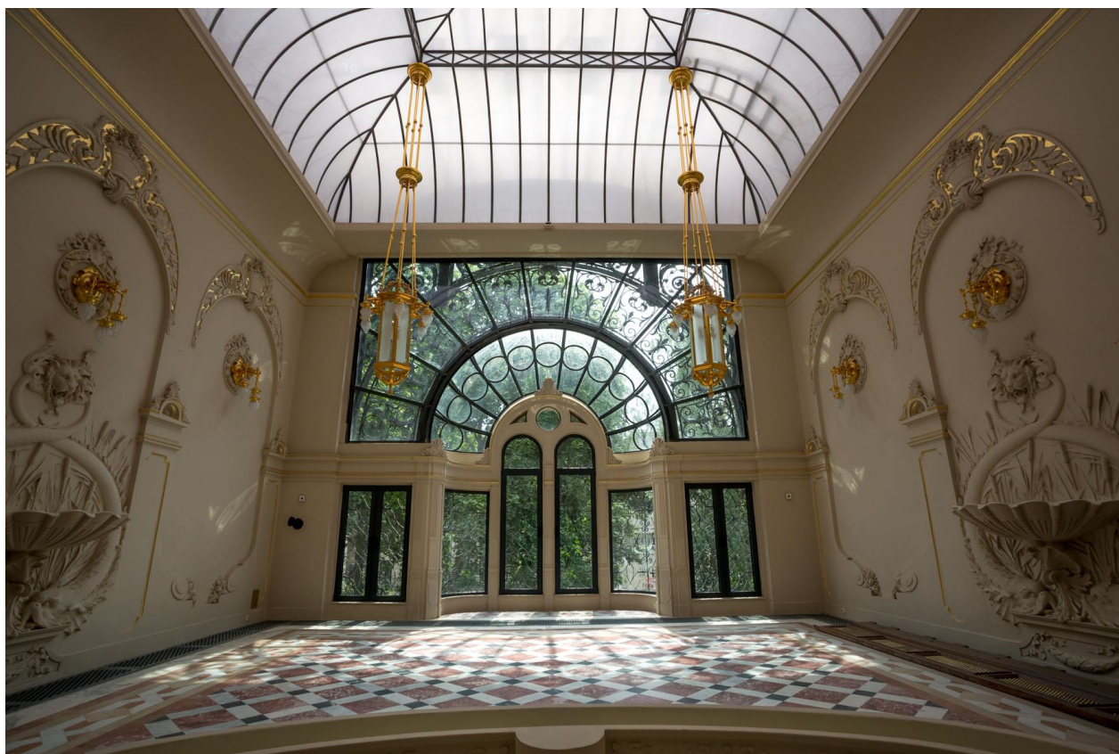
Ogród zimowy w Pałacu Akademii Muzycznej w Łodzi

Studenci niebawem, bo 10 października, zabierają się do pracy. Przeprowadzą dwutygodniowe warsztaty muzyczno-plastyczne przygotowujące dzieci z klas IV-VI do wystawienia bajki Dwie siostry . Na wielki finał czyli premierę zapraszają 22 października (sobota) o godz. 10.00 do Szkoły Podstawowej nr 111 w Łodzi, przy ul. Jaracza 44/46. Wstęp wolny.