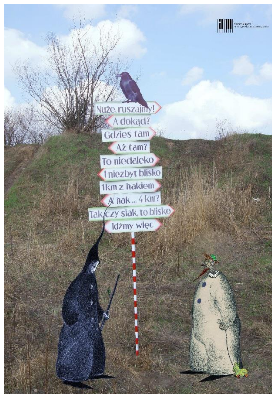
Wieczór muzyczny Cztery kwadransy wierszy donikąd Recital poezji Zdzisława Muchowicza w opracowaniu muzycznym Jana Gromskiego 18 kwietnia, poniedziałek, godz. 18.15, Sala kameralna AM, al. 1 Maja 4, wstęp wolny

„Cztery kwadransy wierszy donikąd” to kolejny koncert z poniedziałkowego cyklu „Wieczór muzyczny”. Odbędzie się 18 kwietnia o godzinie 18.15 w Sali kameralnej Akademii Muzycznej przy al. 1 Maja 4. Będzie to recital poezji Zdzisława Muchowicza w opracowaniu muzycznym Jana Gromskiego. Wstęp wolny!