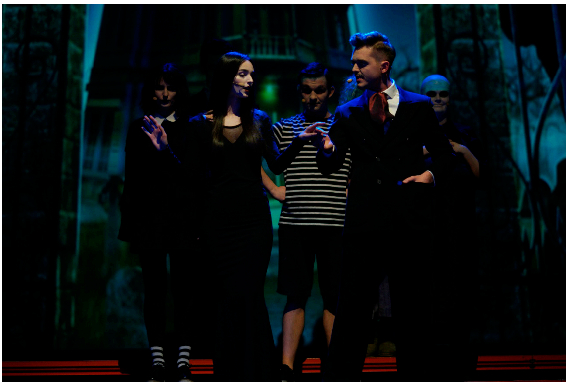
Zdj. 4. Studenci musicalu w piosence „Chcesz być Addamsem”, koncert Karnawał z musicalem, luty 2020 r.