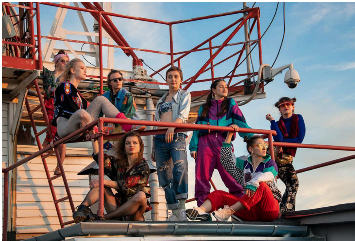
Zdj. 2. Studenci choreografii i technik tańca – projekt „Muzyczna Around the Lodz” 1