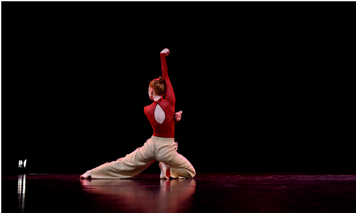
Zdj. 3. Wieczór tańca Kierunek->Choreografia, styczeń 2020 r.