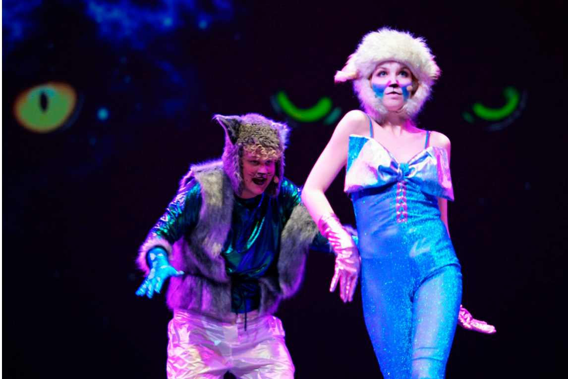
Zdj. 5. Studenci musicalu w piosence „Mangojerrie i Pumpernikiel”, koncert Karnawał z musicalem, luty 2020 r.